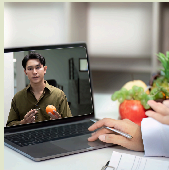
MentalGym Einzelcoaching mit mir persönlich